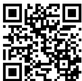
Lost and Found Pets: Houston & Surrounding Areas