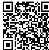
Houston Save-a-Pet and Pet Support