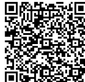
Houston Lost/Found Dogs, Pets